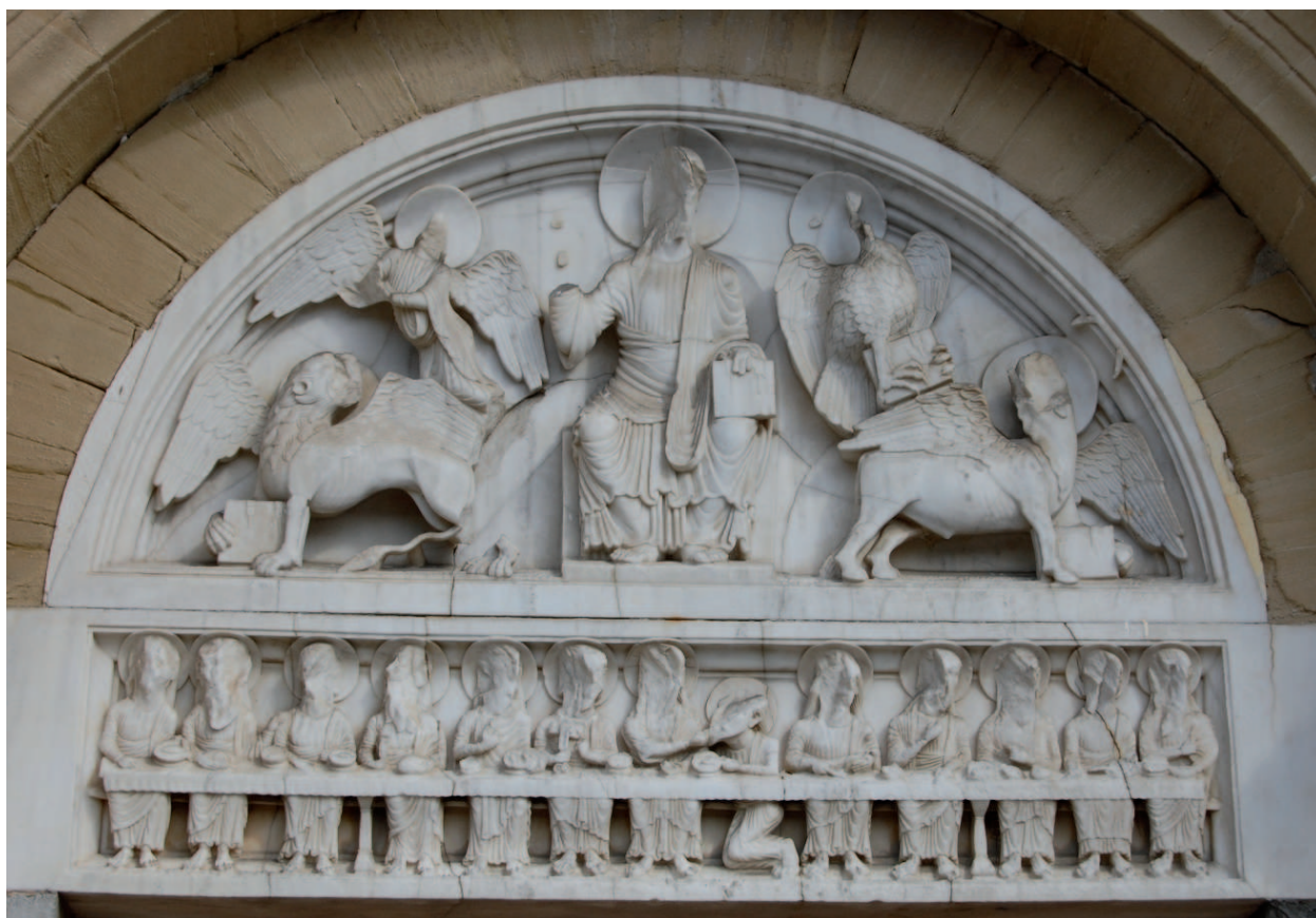
Tympan du portail de la priorale de Vizille

Des travaux récents effectués par le Laboratoire de Recherche des Monuments Nationaux ont permis d'identifier les matériaux des oeuvres sculptées présentées au Musée du Louvre. Plusieurs oeuvres signalées en marbre se sont révélées être réalisées en albâtre et pour la plupart provenant de Notre Dame de Mésage.