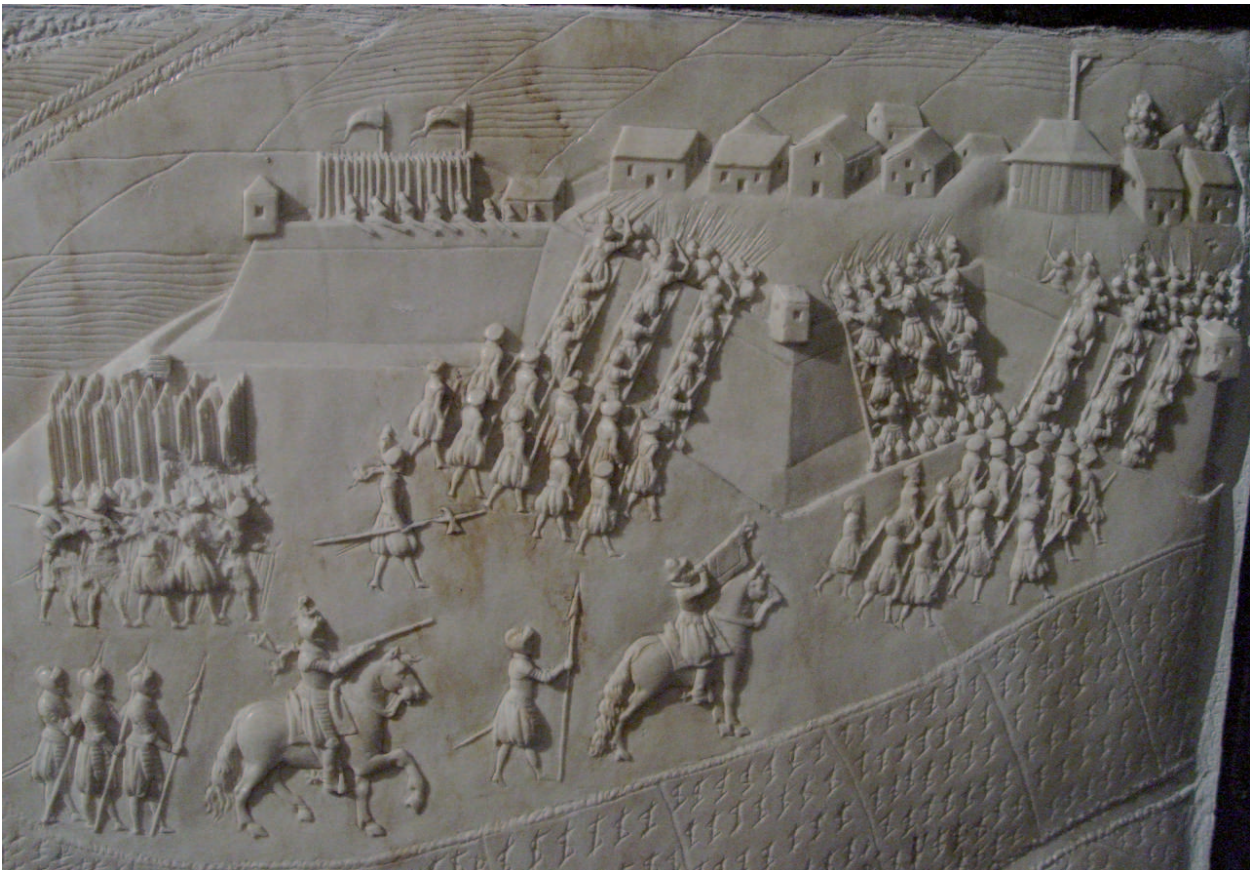
Tombeau de Lesdiguières, batailles sculptées