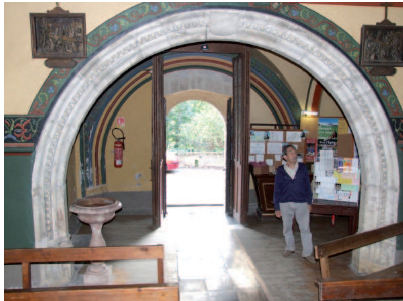
Arc massif aux armes des Armuet Eglise St Etienne Haute Jarrie