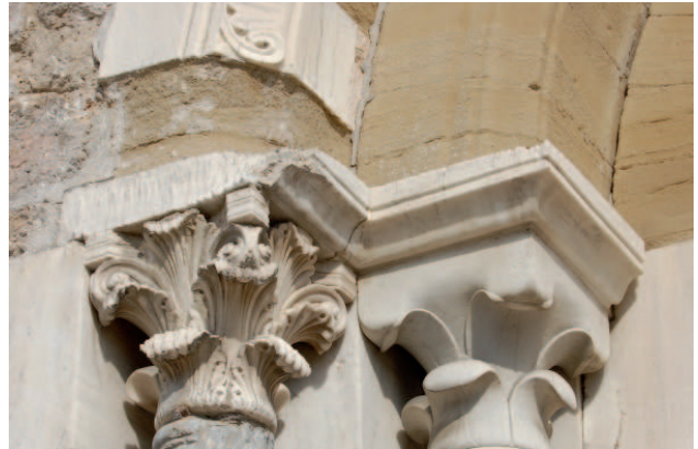
Détail des chapiteaux