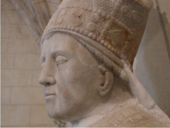
Détail de la statue d'un évêque de Poysieux