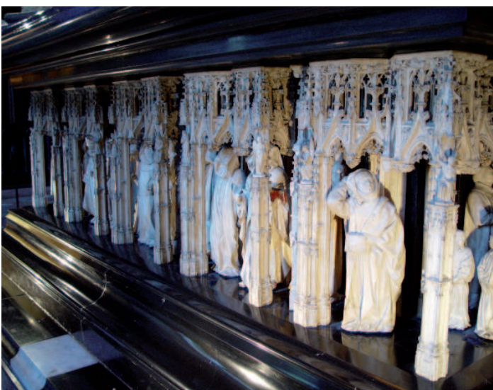
Détail des pleurants, tombeau des Ducs de Bourgogne