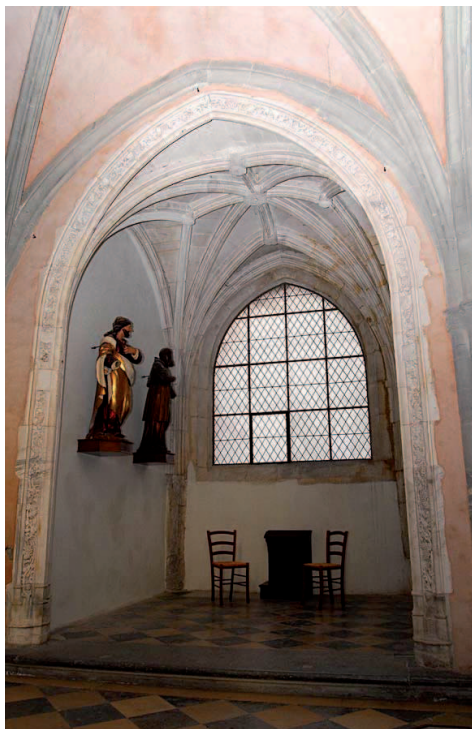
Chapelle Saint Victor, cathédrale de Grenoble