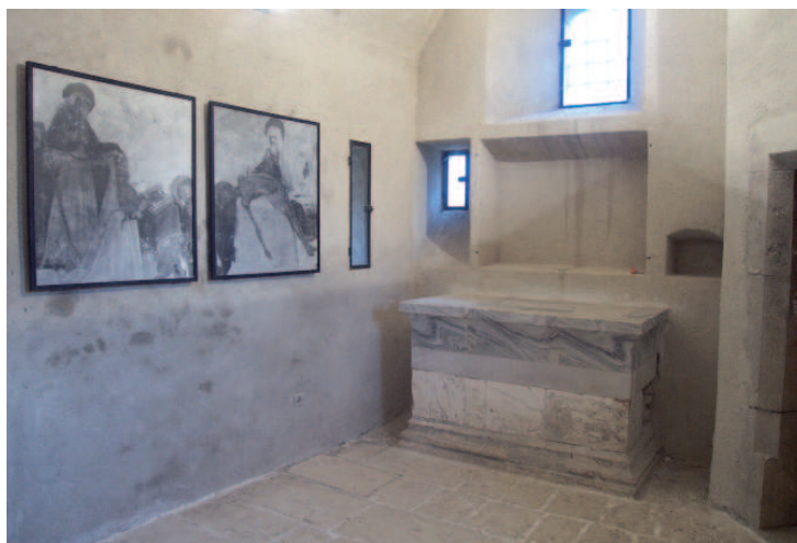
Chapelle de Bon Repos

Autel en albâtre, reconstitué dans la partie haute d'après un autel de Saint Antoine l'Abbaye