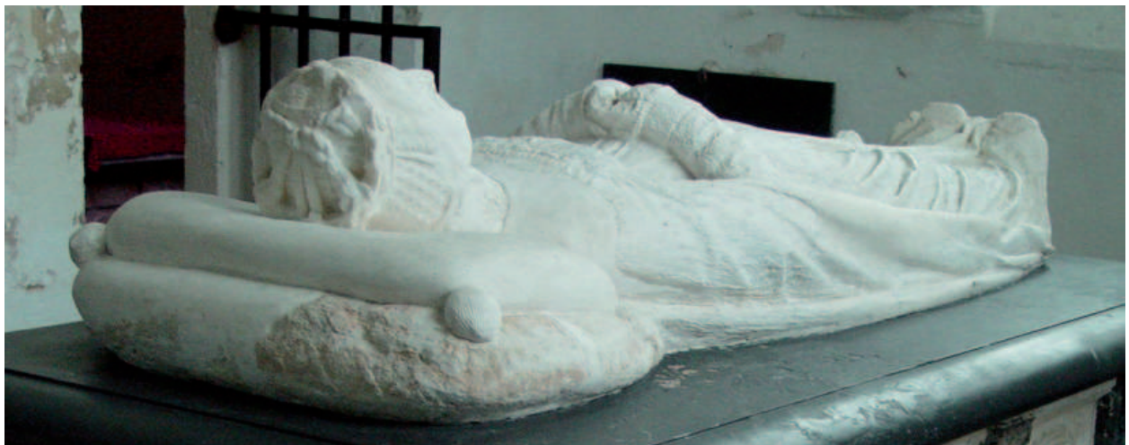
Gisant de Charlotte d'Albray, épouse de César Borgia