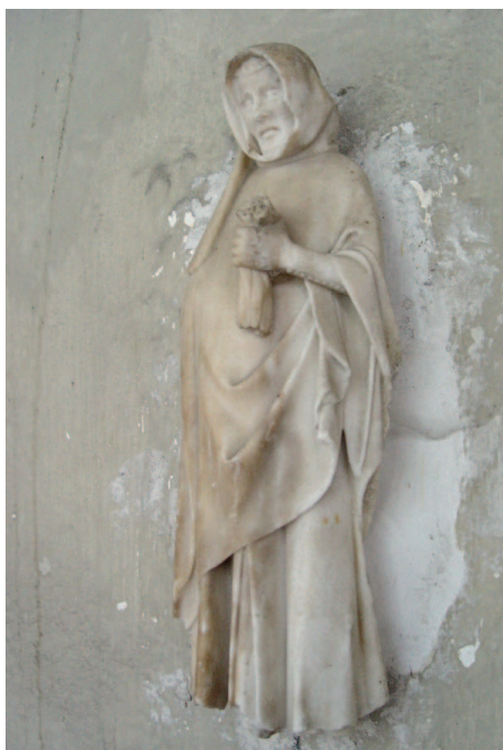
Le pleurant au gant, cloître de l'abbaye de Hautecombe

L'albâtre a été beaucoup utilisé à la demande d'Humbert II qui a fait réaliser des gisants qui étaient installés dans la collégiale Saint André à Grenoble et qui ont été démolis par les protestants lors de la prise de Grenoble en 1562.