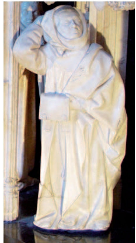
Pleurant, tombeau des Ducs de Bourgogne à Dijon

L'albâtre est difficile à transporter mais il permet de travailler finement avec beaucoup de détails.