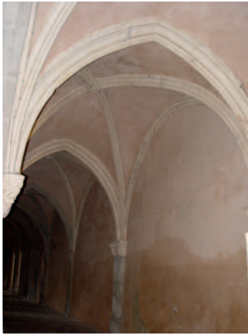
Premières arcatures et chapiteau, bas côté entrée cathédrale de Grenoble