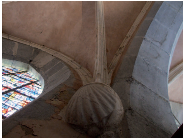
Chapiteau aux armes des Alleman