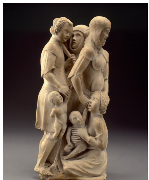
Fragment de «Massacre des Innocents» provenant du retable de la chapelle des princes de l'abbaye de Hautecombe