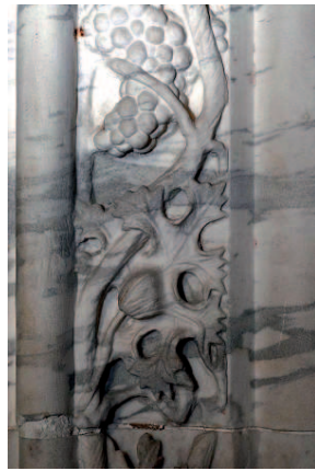
Chapelle Saint Victor cathédrale de Grenoble 2 détails de frises