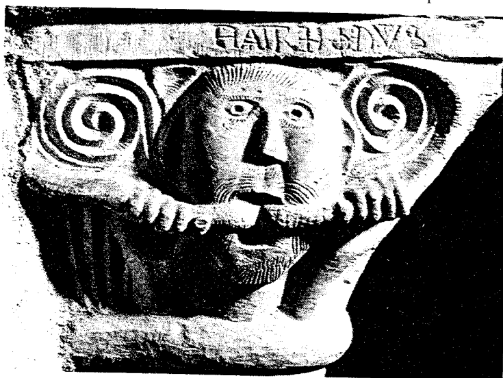
ABBATIALE DE CRUAS, CHAPITEAU DE LA TRIBUNE MONASTIQUE. SIGNATURE DE L'ARTISTE? (HATREBOLDUS)

temps été pris pour une cathédrale et son baptistère. On sait qu'il n'en est rien et que la rotonde (en réalité un octogone) fut plutôt un édifice funéraire (début du XIème siècle). La coupole, soutenue par des arcs entrecroisés reposant sur des colonnes engagées dont certains segments sont des emplois antiques est d'un bel effet.