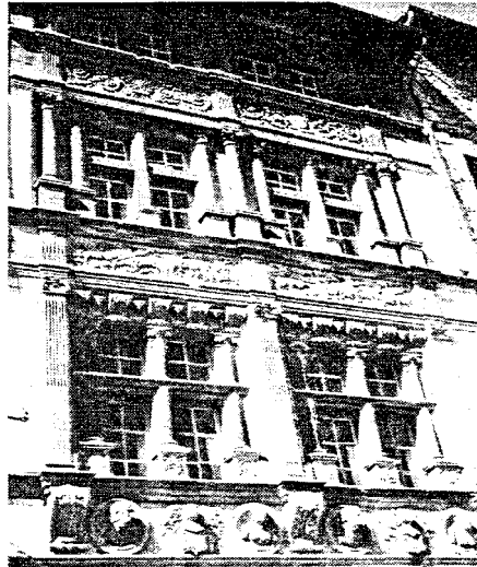
VIVIERS. MAISON DE NOËL ALBERT OU "MAISON DES CHEVAUERS". Milieu DU XVI ème SIÈCLE.

La promenade dans la ville basse, celle des commerçants et artisans, réserve d'agréables découvertes. La "Maison des Chevaliers" associe de manière savoureuse les vocabulaires