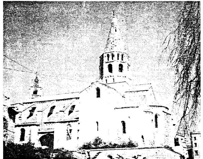
BOURG-SAINT-ANDÉOL. EGUSE SAINT-ANDÉOL, DE STYLE ROMAN PROVENÇAL. CAMPANILE GOTHIQUE.

De beaux hôtels classiques, aux façades majestueuses, aux élégants balcons, écrasent quelque peu les rues étroites. Disposant de plus d'espace, l'hôtel de Roqueplane (aujourd'hui évêché) et l'ancien évêché (aujourd'hui mairie), œuvres de JB. Franque, offrent côté cour et côté jardin des façades régulières, précieuses par un discret décor et de justes proportions.