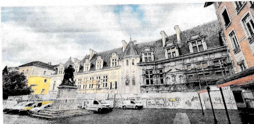
Les travaux sont plus visibles depuis la place Saint-André.

travaux sont menés face à l'état de vétusté de certaines parties. En août 1897, le nouvel ensemble est inauguré par le président de la République. En septembre 2002, trop petit, l'édifice est déserté par les fonctions judiciaires. Inscrit dans sa totalité à l'inventaire des Monuments historiques en 1992, il est désormais la propriété du Département de l'Isère.