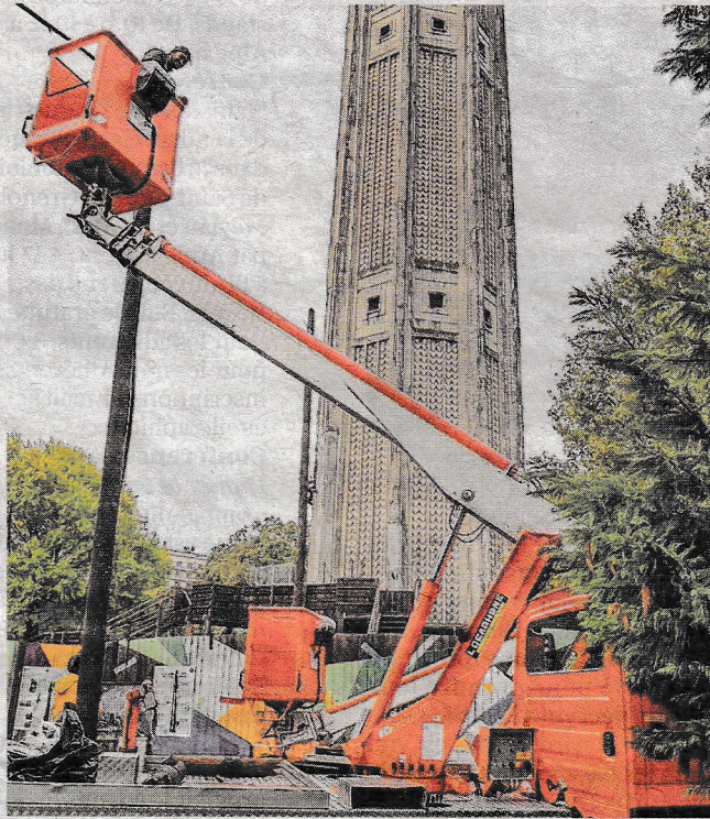
Le chantier est estimé à 16,5 millions d'euros.

L'objectif est toujours de rouvrir pour le centenaire de la Tour, en 2025. La collecte participative, lancée avec la Fondation du patrimoine, se