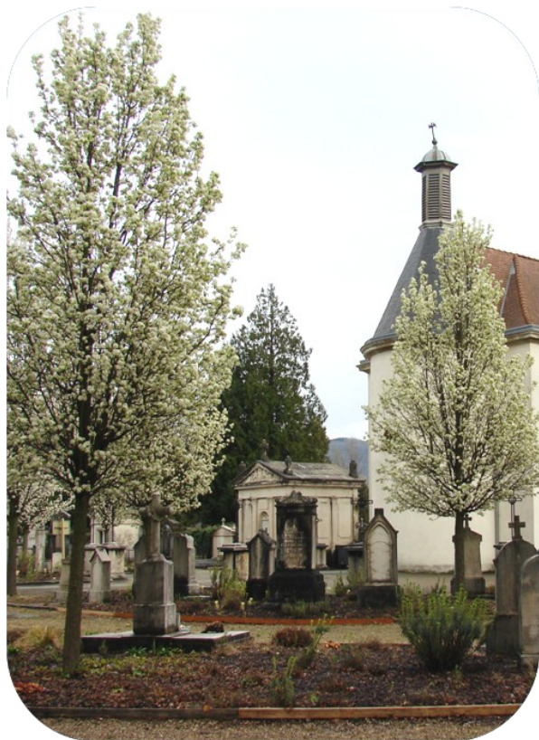
Le printemps au cimetière Saint-Roch